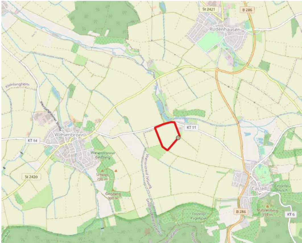
Abbildung 1: Lage des Untersuchungsgebiet (rot umrandet) (Karte: OpenStreetMap)

Auftraggeber: Greenovative GmbH Frau Steub Fürther Str. 252 90429 Nürnberg