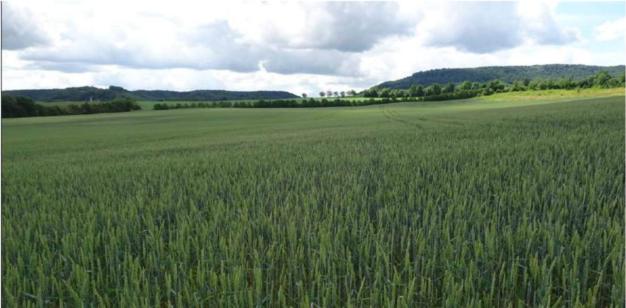
Abbildung 3: Das Vorhabensgebiet, Blick von Nord nach Süd