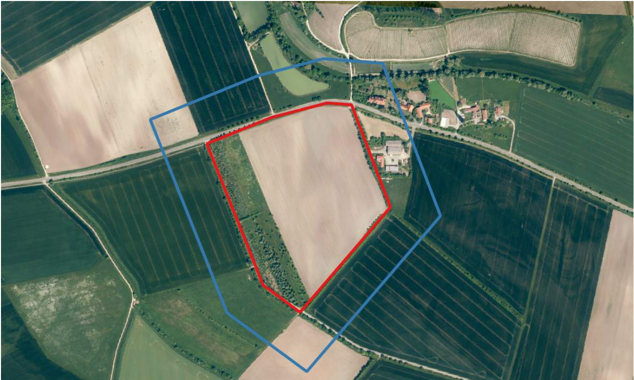
Abbildung 2: Übersicht über das Vorhabensgebiet (rot umrandet), sowie das größer gefasst Untersuchungsgebiet (blau umrandet)

Da die Wirkung eines Bauvorhabens meist über das eigentliche Vorhabensgebiet hinaus reicht, wird das Untersuchungsgebiet, innerhalb welchem Kartierungen stattfanden, leicht größer gefasst.