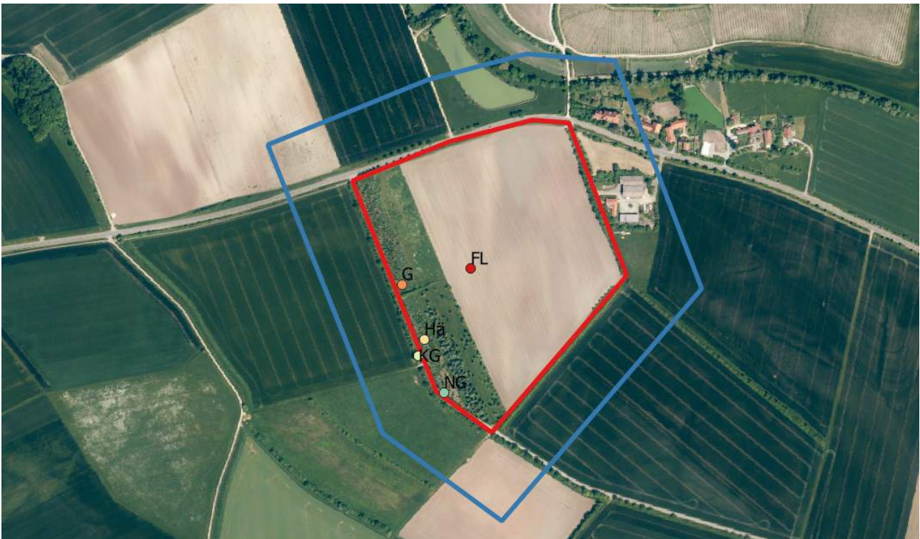
Abbildung 8: Revierzentren der saP-relevanten Brutvögel: Feldlerche (rot), Goldammer (orange), Bluthänfling (gelb), Klappergrasmücke (hellgrün), Nachtigall (dunkelgrün)

Im Untersuchungsgebiet konnten trotz Kartierungen keine Rebhühner nachgewiesen werden.