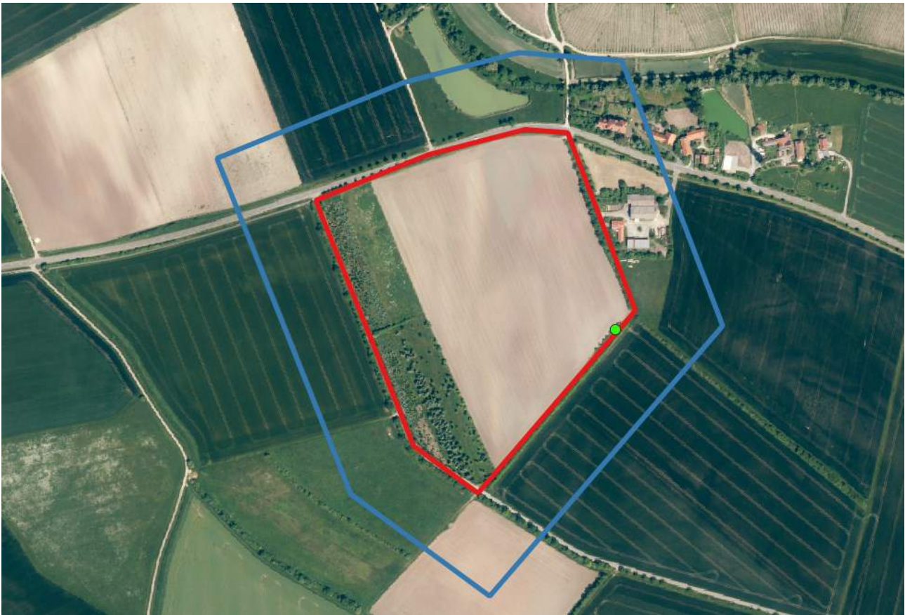
Abbildung 7: Fundort Zauneidechse