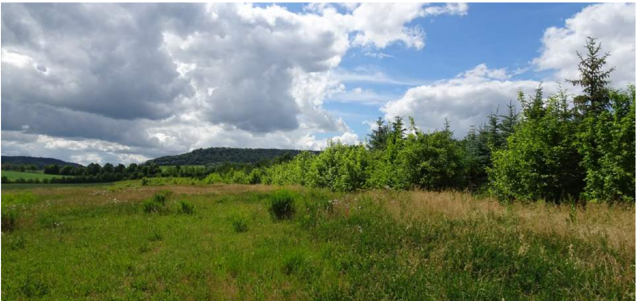
Abbildung 4: Die Christbaumplantage, sowie die angrenzende extensive Wiese

Unter Absprache mit der Unteren Naturschutzbehörde des Landratsamtes Kitzingen wird in diesem Zusammenhang das Untersuchungsgebiet auf die Artengruppen Vögel und Reptilien geprüft.